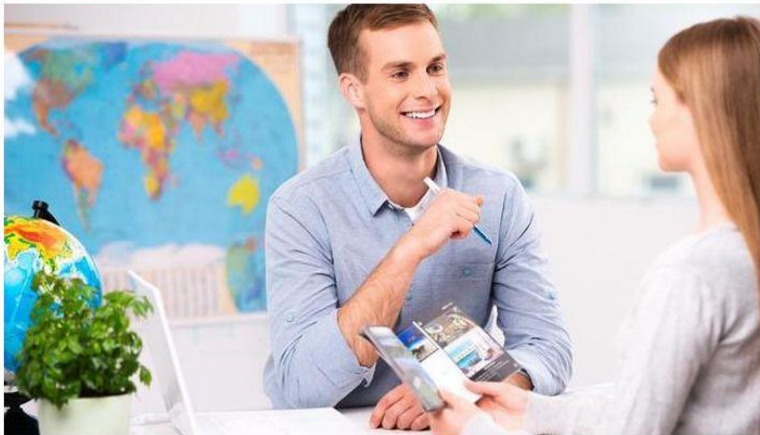
Aktuell zählt das TUI-Premium-Partner-Modell 225 Reisebüros.

Aktuell zählt das TUI-Premium-Partner-Modell den Angaben zufolge 225 Reisebüros, die von besonders attraktiven Vergütungen seitens der TUI profitieren: Während Klassik-Partner bei der TUI für 225.000 Euro Umsatz 10,05 Prozent Provision kassieren, heimsen Premium-Partner 10,3 Prozent ein.